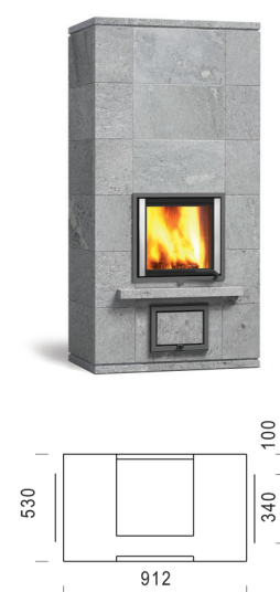
HESTIA SOLO 180-1