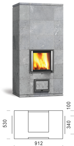
HESTIA SOLO 180